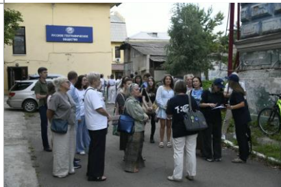
Пешеходная экскурсия «РГО в Красноярске. Начало»