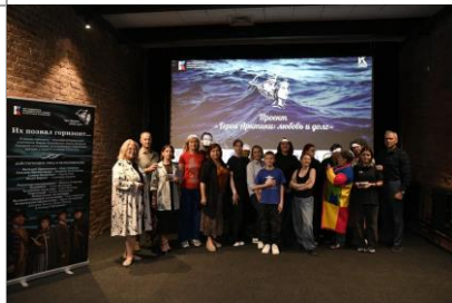
Кинопоказ спектакля «Герои Арктики. Любовь и долг»