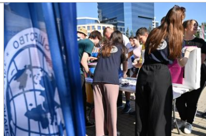
Площадка РГО на забеге, посвященном 180-летию РГО