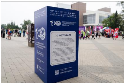
«Жара» - забег на дистанцию 5 километров, посвященным 180-летию РГО