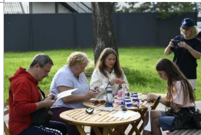
Мастер-класс «Создай свой маяк»