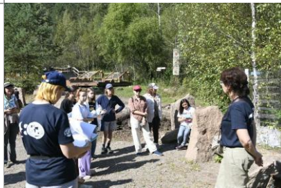
На площадке РГО «Заповедная Сибирь» экскурсии, квесты, игры.