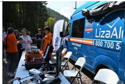
Практикум добровольческого поисково-спасательного отряда «ЛизаАлерт».