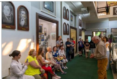
Экскурсия «РГО и Красноярский музей»