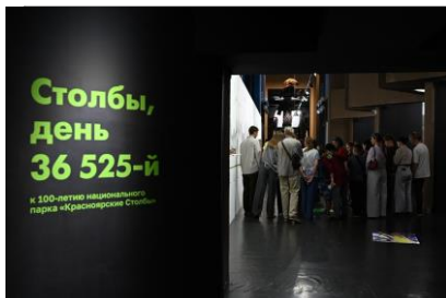
Экскурсия по выставке «Столбы, день 36525-й»