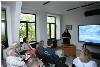
Лекции-презентации «От экспедиции до выставки»