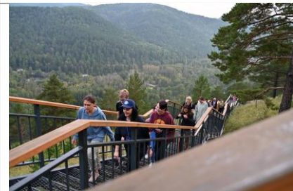
Экскурсия на самую длинную лестницу в России Торгашинскую и Торгашинский хребет.