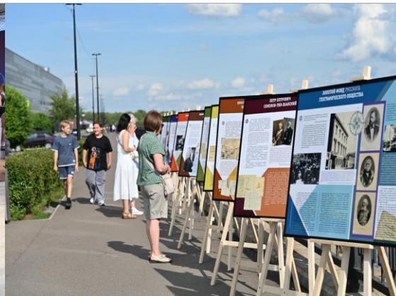
Выставка «История РГО в лицах»