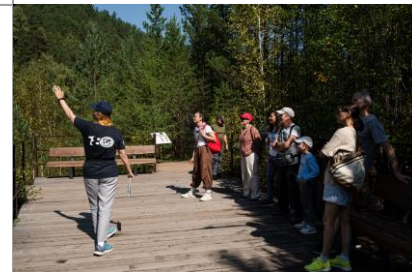
Экскурсия «РГО на Столбах», 100 лет сотрудничества. Экскурсия-поход «По тропе к Ермаку»