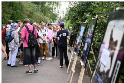
Выставка «Говорит и показывает Евражка»