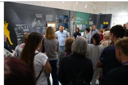
Экскурсия «Геология Красноярского края»