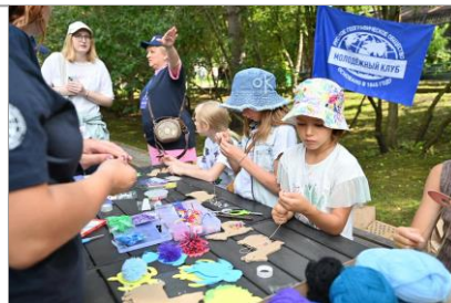
Мастер-классы про животных от Молодежных клубов РГО