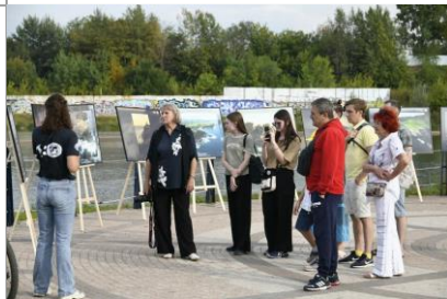
Выставка «Маяки России»