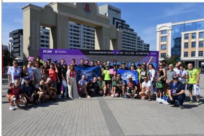
«Жара» - забег на дистанцию 5 километров, посвященным 180-летию РГО