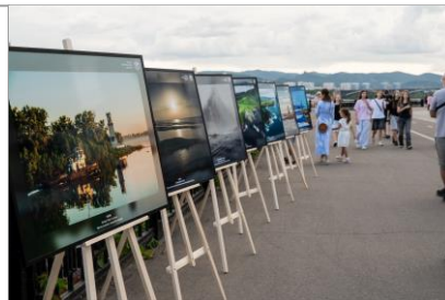
Фотовыставка «Маяки России»