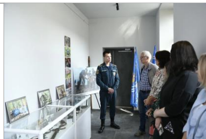
Выставка «Поисковые экспедиции МК «Звезда спасения»