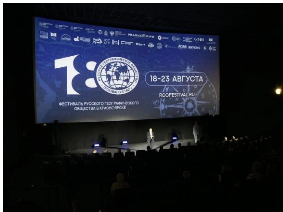
Церемония открытия первого фестиваля Русского географического общества в Красноярске.