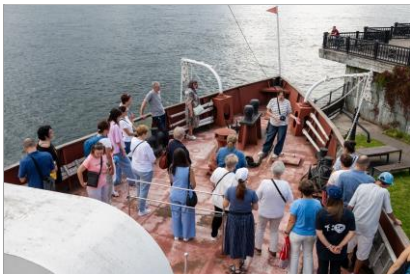
Экскурсия «Тайны старого парохода»