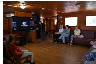
Кинопоказ Д/Ф «Большая вода Енисей»