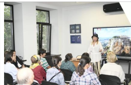
Кинопоказ Д/Ф «Крылья» Встреча с реж.Э.Астраханцевой