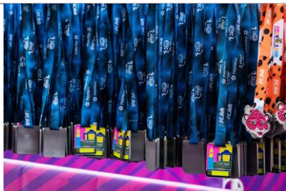
«Жара» - забег на дистанцию 5 километров, посвященным 180-летию РГО