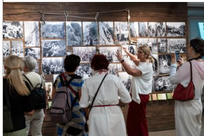
Экскурсия по выставке «Степан Орлов. Столбы и столбисты»