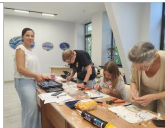
Мастер-класс по созданию мозаики из смальты «Хозяин Арктики»