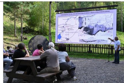
Лекция «В поисках динозавров Шарыповского района»