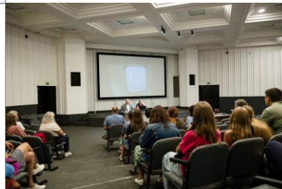
Встреча с участниками кругосветной экспедиции на яхте «ЕЛИЗАВЕТА»