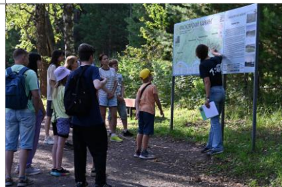
Экскурсия-поход по экопарку «Гремячая Грива»