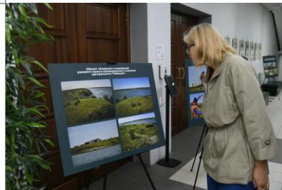
Выставка «Преображение Таймыра»