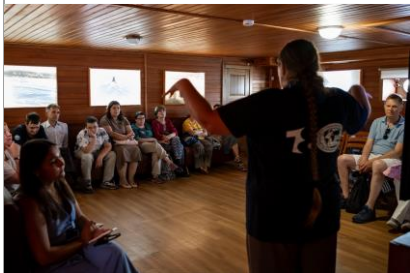
Лекция «Заповедная природа на берегах большой реки»