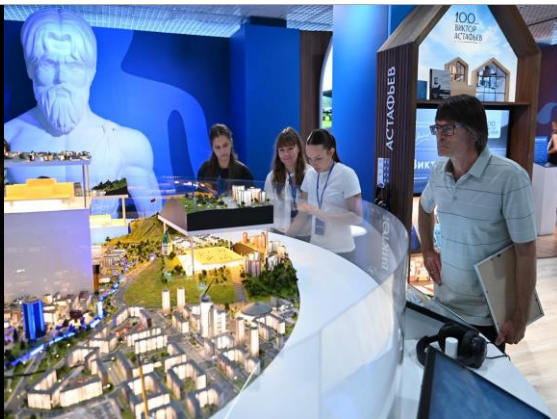
Экскурсия по выставке достижений «Россия»