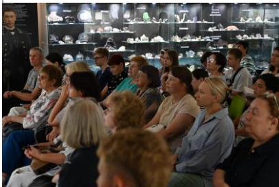
Кинопоказ «Охотники за ураном. Красноярское дело геологов»