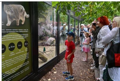
Экскурсия по парку флоры и фауны «Роев Ручей»